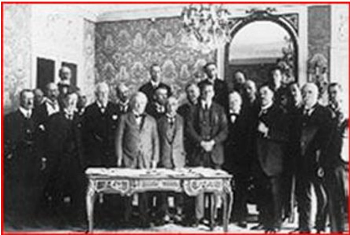
Մերի Խաղաղության պայմանագրի մասնակիցները