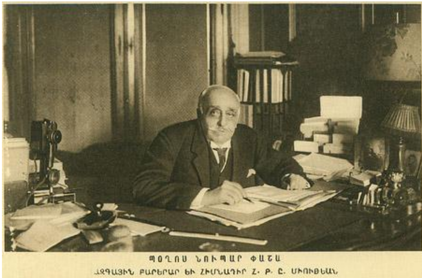
Արեւմտյան Հայաստանի Ազգային Խորհրդի Նախագահ Պողոս Նուբար Փաշա