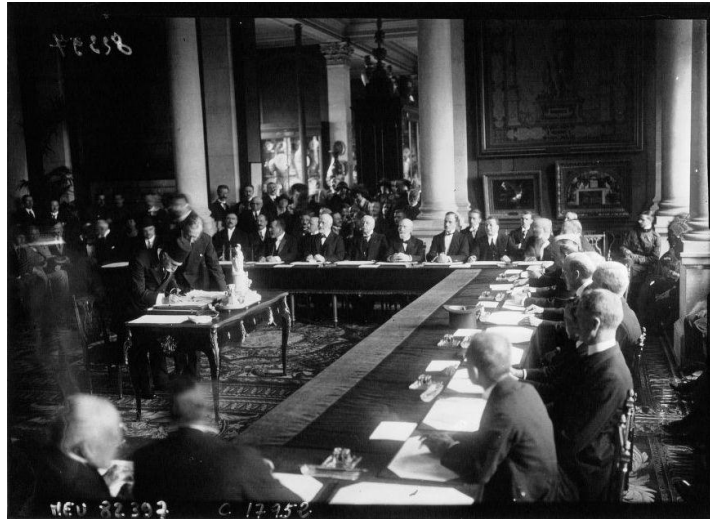
Մերի Խաղաղության պայմանագրի տակ իր ստորագրությունն է դնում թուրքական պատվիրակությունը