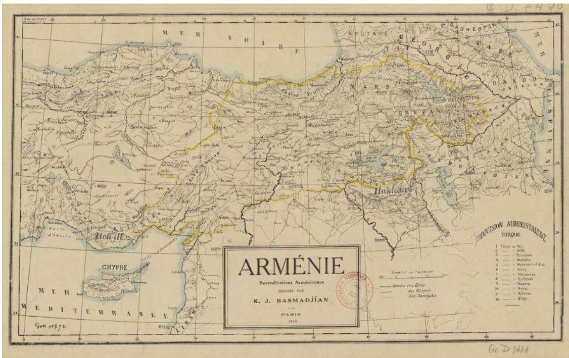
Հայաստանի էթնոգրաֆիական քարտեզը